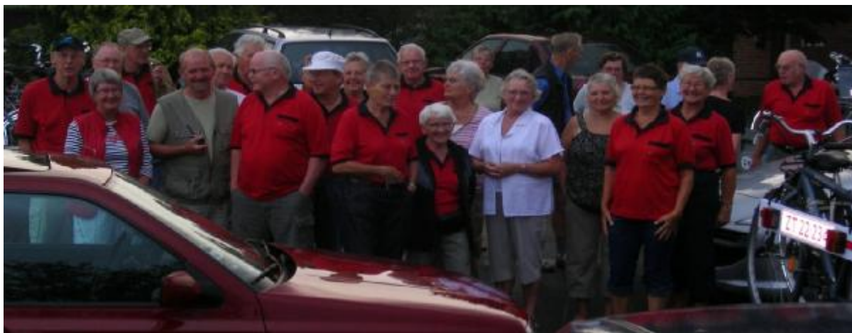
25 glade og forventningsfulde cyklister, klar til 5 dages strabasser i omkring Pløner søerne.

Alle takker Irene for en vel tilrettelagt cykelferie