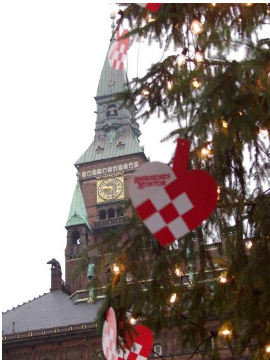
Københavns Kommune

... så blev det også Jul i Dronningens København